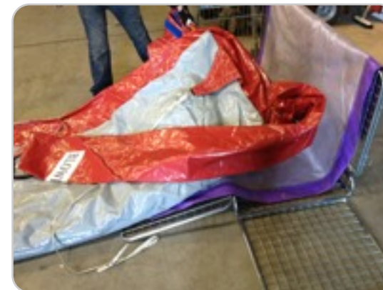
Stap 8: Klap de achterkant van het springkussen terug. Zodat het in de kar / transportzak past.