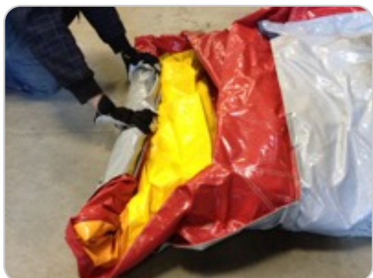
Stap 9: Rol het springkussen vanaf de voorzijde op. Rol vanaf het begin goed strak en recht! Niet vouwen!