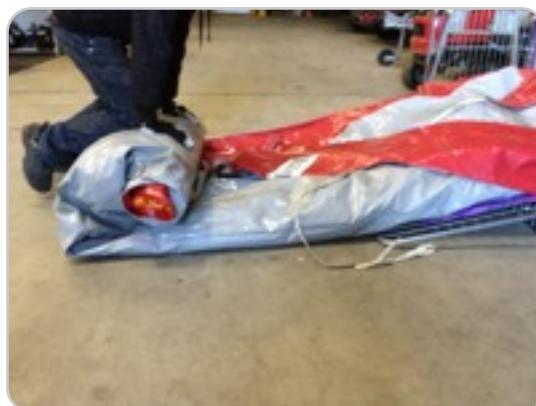
Stap 10: Rol het springkussen naar achteren op, druk met knieën en handen de lucht uit het pakket. (2 pers.)