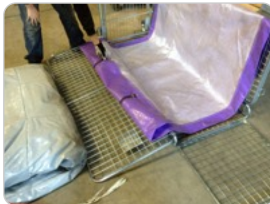
Stap 7: Leg het transportzeil / de spanbanden klaar in de kar met de gespen aan de voorzijde.