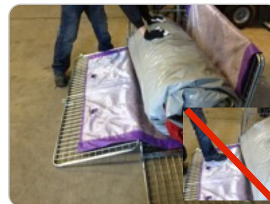
Stap 11: Rol het springkussen tot in de kar. Ga niet met uw voet op het hek staan.